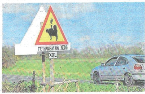
La première réserve porte sur les aménagements routiers à réaliser et le trafic qu'induirait le méthaniseur.

« Prendre des mesures de compensation financière ou d'acquisition des habitations situées dans un rayon de 1 km autour du projet pour les riverains qui le souhaiteraient. »