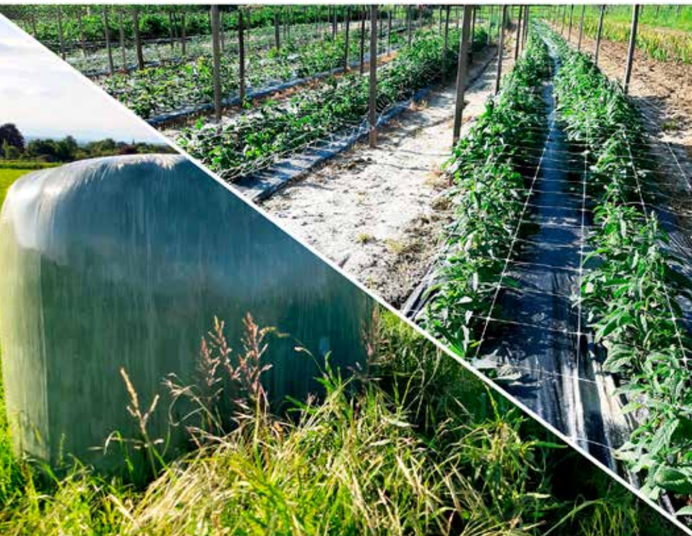
Figure 1 | L'agriculture suisse utilise divers produits en plastique, allant des films pour balles d'ensilage (à gauche) aux films de paillage, en passant par les filets de support (à droite).

Renseignements: Thomas D. Bucheli, e-mail: thomas.bucheli@agroscope.admin.ch